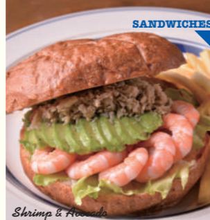
Shrimp & Avocado