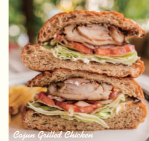
Cajun Grilled Chicken