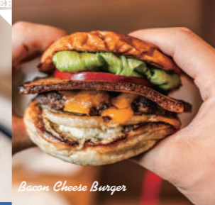
Bacon Cheese Burger