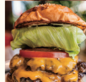
Double Cheese Burger