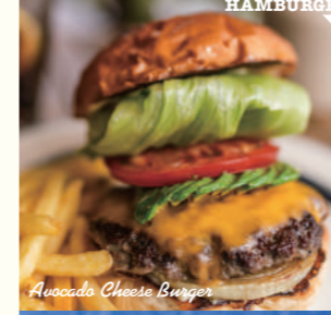
Avocado Cheese Burger