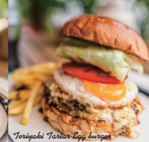
Teriyaki Tartar Egg burger