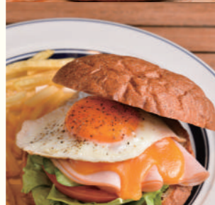
Sunny-side Up Eggman (Ham)