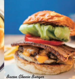
Bacon Cheese Burger