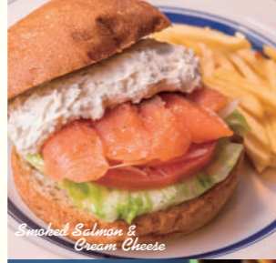
Smoked Salmon & Cream Cheese