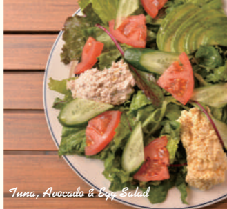
Tuna, Avocado & Egg Salad