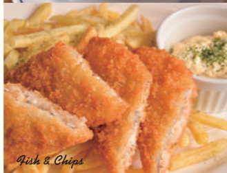
Fish & Chips